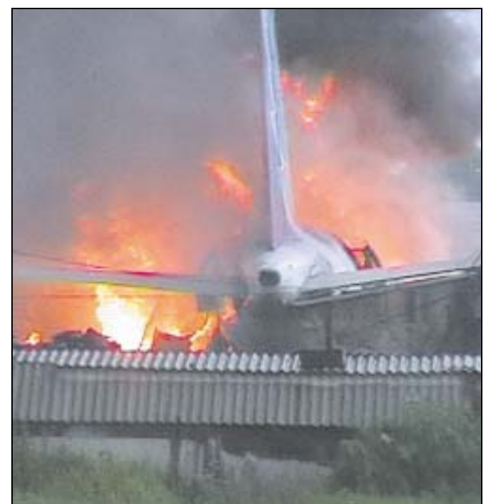
Die Passagiermaschine schoss über die Landebahn hinaus, explodierte und ging in Flammen auf.

MOSKAU. Bei der Bruchlandung eines russischen Verkehrsflugzeugs in Sibirien sind gestern mindestens 120 Insassen getötet und 50 verletzt worden. Unter den Toten sind Medienberichten zufolge viele Kinder, die am beliebten Baikalsee Ferien machen wollten. Das Auswärtige Amt in Berlin bestätigte zunächst Medienberichte nicht, wonach unter den Überlebenden auch eine Deutsche sei. Der Airbus A-310 aus Moskau mit 200 Menschen an Bord sei bei der Landung in der sibirischen Stadt Irkutsk über die Rollbahn hinausgeschossen und in Betonabsperungen und Gebäude gestürzt, erklärten die Behörden. Die Maschine sei explodiert und in Flammen aufgegangen. (rtr) ■ GLOBUS