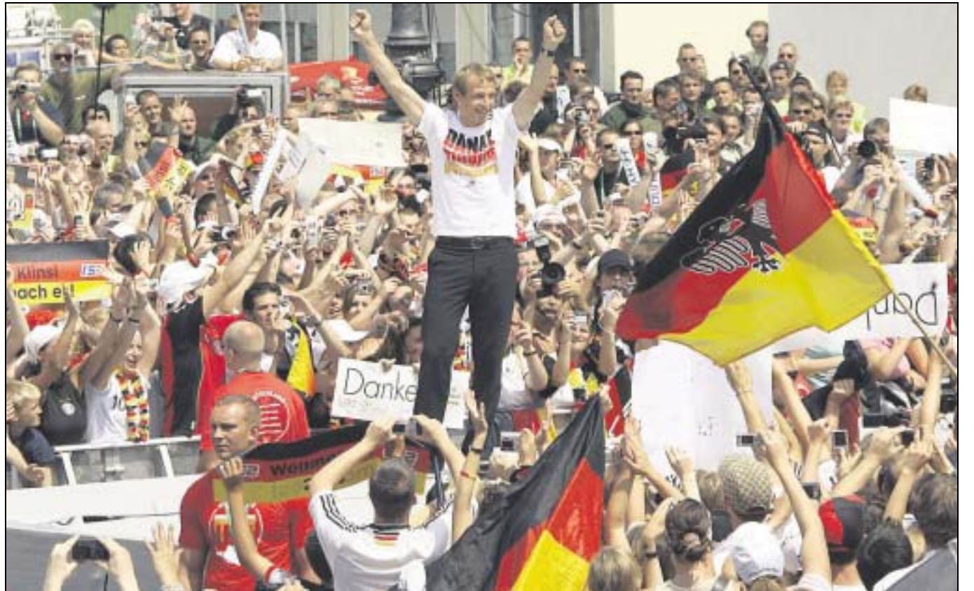
Danke, Klinsi! Hunderttausende feierten die deutsche Nationalmannschaft und den Bundestrainer auf der Berliner Fan-Meile enthusiastisch. Und alle Fußball-Fans hoffen: Jürgen Klinsmann macht weiter.