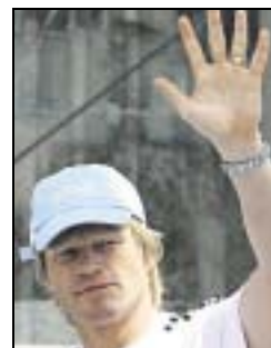
Auf Wiedersehen: Oliver Kahn verabschiedet sich aus der Nationalelf.

Zwar scheint die Trainerfrage längst zu einer Angelegenheit von nationaler Tragweite geworden zu sein. Doch der Bundestrainer wollte sich auch nach einem tollen Spiel um Platz drei und nach einem begeisternden WM-Ausklang gestern auf der Fan-Meile in Berlin von den „Liebesbun-